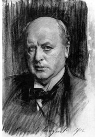
Henry James, retrato realizado por el artista John Singer Sargent en 1913.

Cuentan con una serie de instrumentos supersensibles: micrófonos direccionales y de gran ángulo; cámaras cargadas con películas como las usadas por la NASA; haces de rayos láser con realización holográfica; células fotovoltaicas, de efecto Kirlian para captar imágenes irreales como las auras corporales;