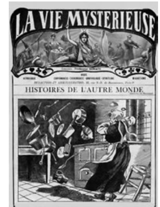
Una empleada doméstica de 14 años, Therese Selles, experimenta el poltergeist en su lugar de trabajo. Portada de la revista francesa La Vie Mystérieuse , 1911.

La lista de tales travesuras es larguísima: los objetos cambian de lugar, aparecen y desaparecen, flotan en el aire. Surgen de ninguna parte, a veces a través de las paredes y los techos (a eso se llama “aportes”). Las luces se prenden y apagan solas y los aparatos eléctricos tienen desperfectos momentáneos e interferencias. Se oyen voces, ruidos, música, silbidos, etc., sin que se pueda identificar qué los produce. Aparecen escritas o dibujadas las paredes. Las puertas y ventanas se abren o cierran solas. Lluven piedras y todo tipo de sustancias, algunas malolientes o nauseabundas. Ocurren pequeños incendios e inundaciones y las personas que se encuentran en la casa pueden sufrir golpes, pellizcos y hasta escupidas. Y todo en medio de